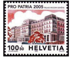
Почтовая марка Швейцарии с изображением здания «Пале-Вильсон»

Некоторая часть персонала УВКПЧ работает также в здании европейской штаб-квартиры ООН в Женеве на авеню Джузеппе Мотта, недалеко от Дворца Наций.