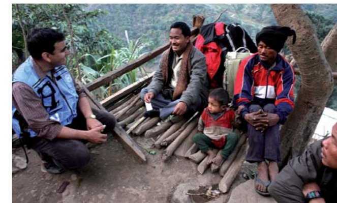
Сотрудники УВКПЧ проводят беседу о правах человека в Непале

При организации представительств или самостоятельных офисов в стране УВКПЧ согласовывает с правительством принимающей страны мандат деятельности, включающий как вопросы поощрения прав человека, так и их защиту. Представительства УВКПЧ были созданы в Боливии, Камбодже, Колумбии, Гватемале, Мексике, Непале, Того и Уганде, а также на оккупированных палестинских территориях и в Косово (Сербия).